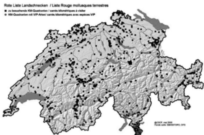
Abb.: Kartendarstellung der Fundpunkte.

Resultate 2005: Im vergangenen Jahr wurden rund 200 km 2 besucht. Dabei konnten 173 Arten, davon 97 Zielarten, mindestens einmal nachgewiesen werden. 26 Zielarten wurden mindestens 10 mal lebend oder frisch tot gefunden. Die restlichen 101 Arten wurden seltener gefunden, davon 30 gar nie, resp. von 2 Arten nur Leergehäuse unklaren Alters. Einige Arten mit älteren Einzelnachweisen waren im ersten Jahr noch nicht im Programm vorgesehen.