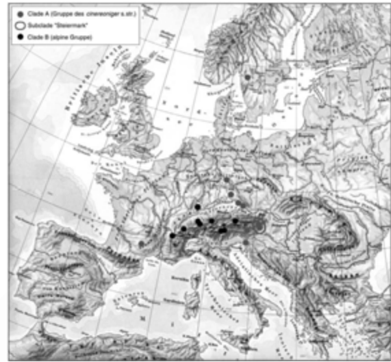
Fig.: Fundpunkte der molekulargenetisch untersuchten Tiere aus der Limax cinereoniger -Gruppe (Kartengrundlage: Diercke Weltatlas 1971, verändert).

Ob die von GERHARDT postulierte taxonomische Differenzierung auf unsere molekulargenetischen Feststellungen ausgeweitet werden kann, wird sich nach weiteren Untersuchungen zeigen. Neben der biologischen ist allerdings auch eine nomenklatorische Klärung notwendig, da für alpine Formen von " L. cinereoniger " eine Reihe von Namen existiert, die älter sind als der von GERHARDT eingeführte.