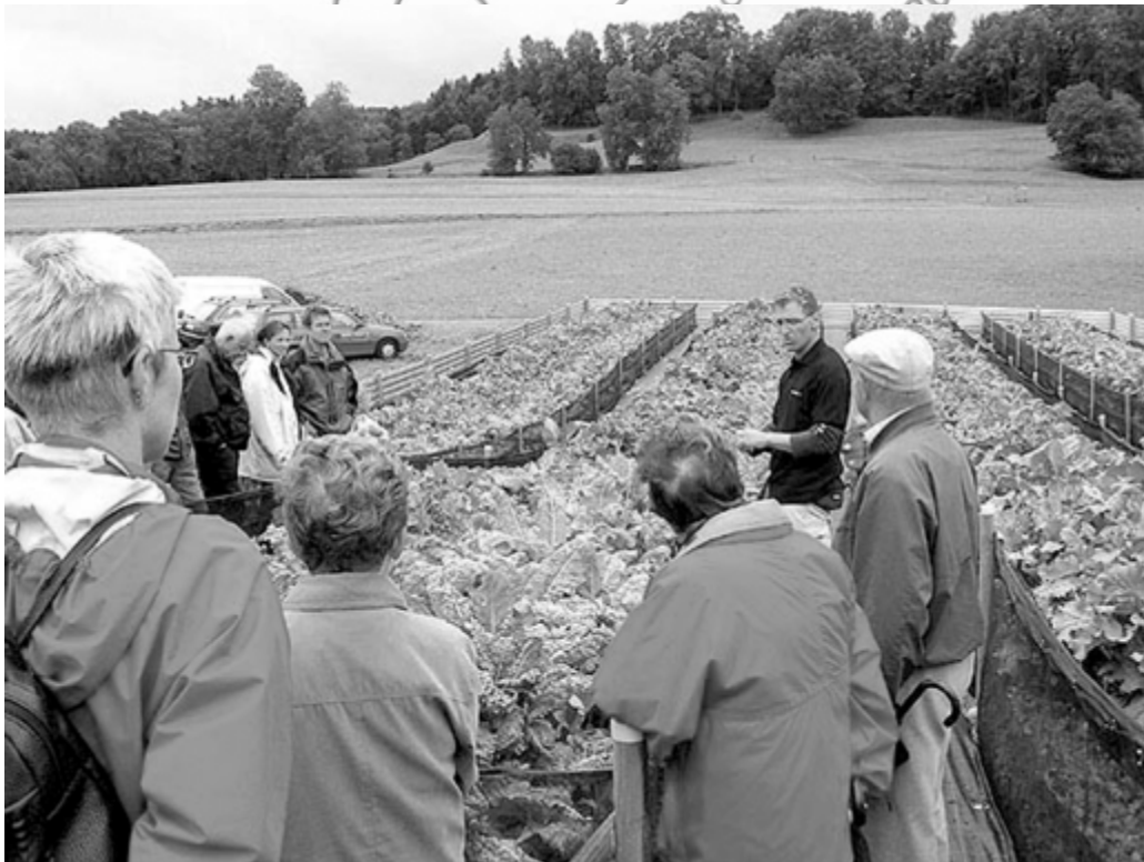
Abb.: Tag der offenen Tür auf der Schneckenfarm Elgg (Schweiz)

Welche Möglichkeiten gibt es, Verluste durch Beutegreifer zu minimieren, ohne chemische Mittel einzusetzen ?